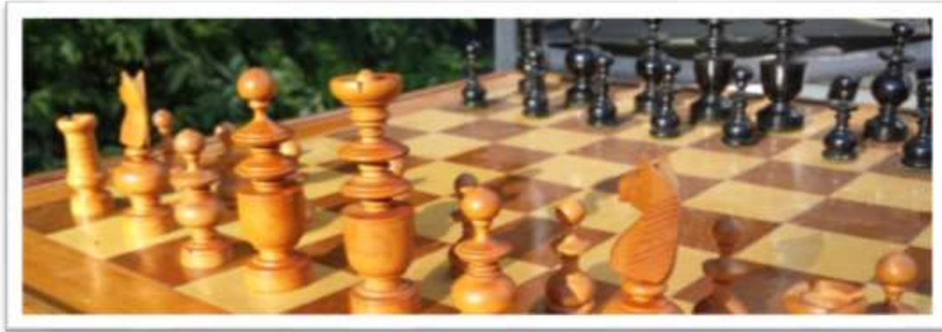
'Régence' schaakstukken uit de collectie van Old in Chess antiques